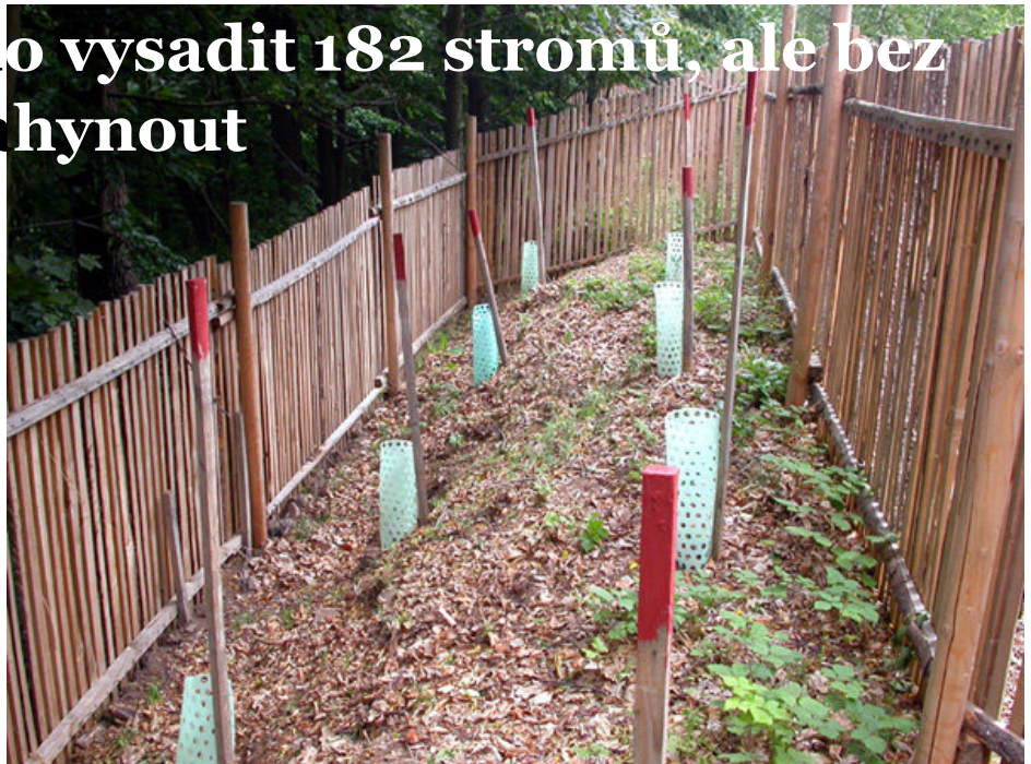
Jedna z oplocenek, v níž je 182 kusů sazenic vzácného stromu jeřábu.

Na základě této výjimky pak firma Narcis Slatina, s. r. o., vysadila v lo- mu Prackovice 182 kusů náročně vypěstovaných sazenic, přičemž zjistila, že bez péče dochází k ročnímu úhynu až třiceti procent stromků. Za