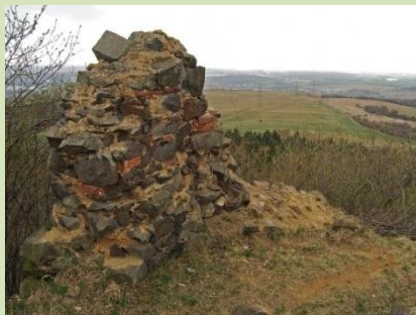
Hory a ruiny: proč se nám líbí