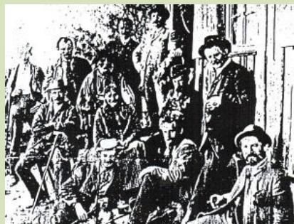
Od kořenů po současnost