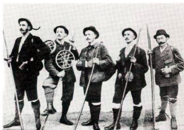
Výstroj a výzbroj turistů na přelomu 19. a 20. století

Současně se skončením války hnutí Přátel přírody obnovilo svou činnost a snažilo se také o navrácení zabave-