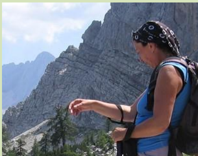
Objevovali hory jižní Evropy

9 | 2012 | bulletin asociace Přátelé přírody ČR | www.pratele-prirody.cz | zdarma